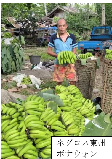
ネグロス東州 ボナウン

昨年12月の台風で大きな被害を受けた balan ンバナナ産地。被害の大きかったネグロス島では出荷量が一時5割程度まで減少しました。被災後、懸命な復興作業が展開され多くの苗の植え直しが行われ、1年経った現在被災前の水準まで回復することが出来ました。