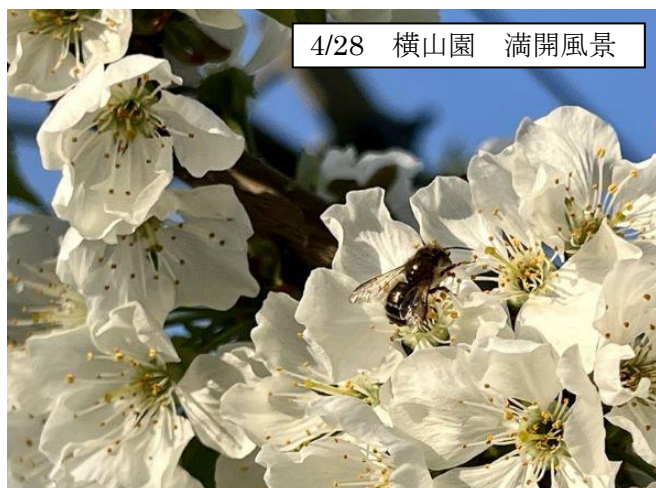
4/28 横山園 満開風景

米沢郷(山形県)では、4月下旬にさくらんぼが満開を迎えました。昨年は開花前の低温被害で大凶作となりましたが、今年は花も多く咲き無事に受粉作業を終えることが出来て、一安心…。