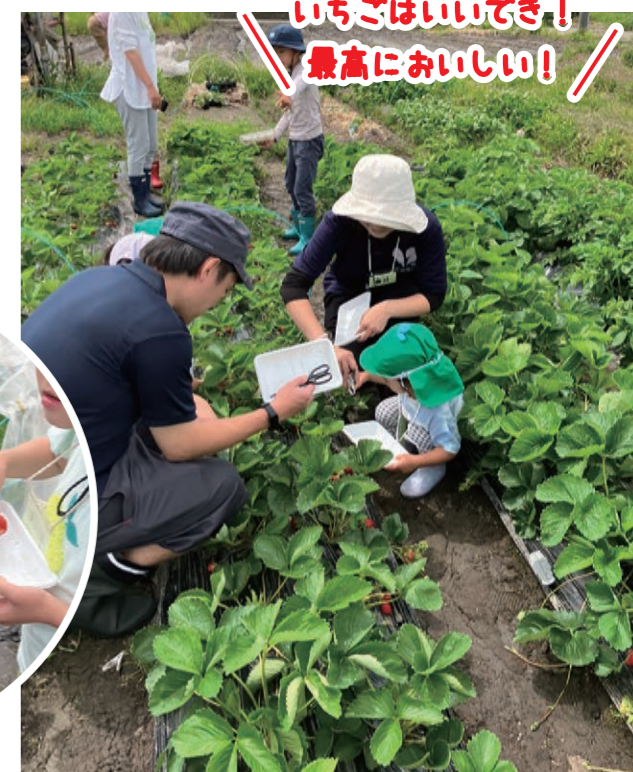
いちごはいいでき！ 最高においしい！