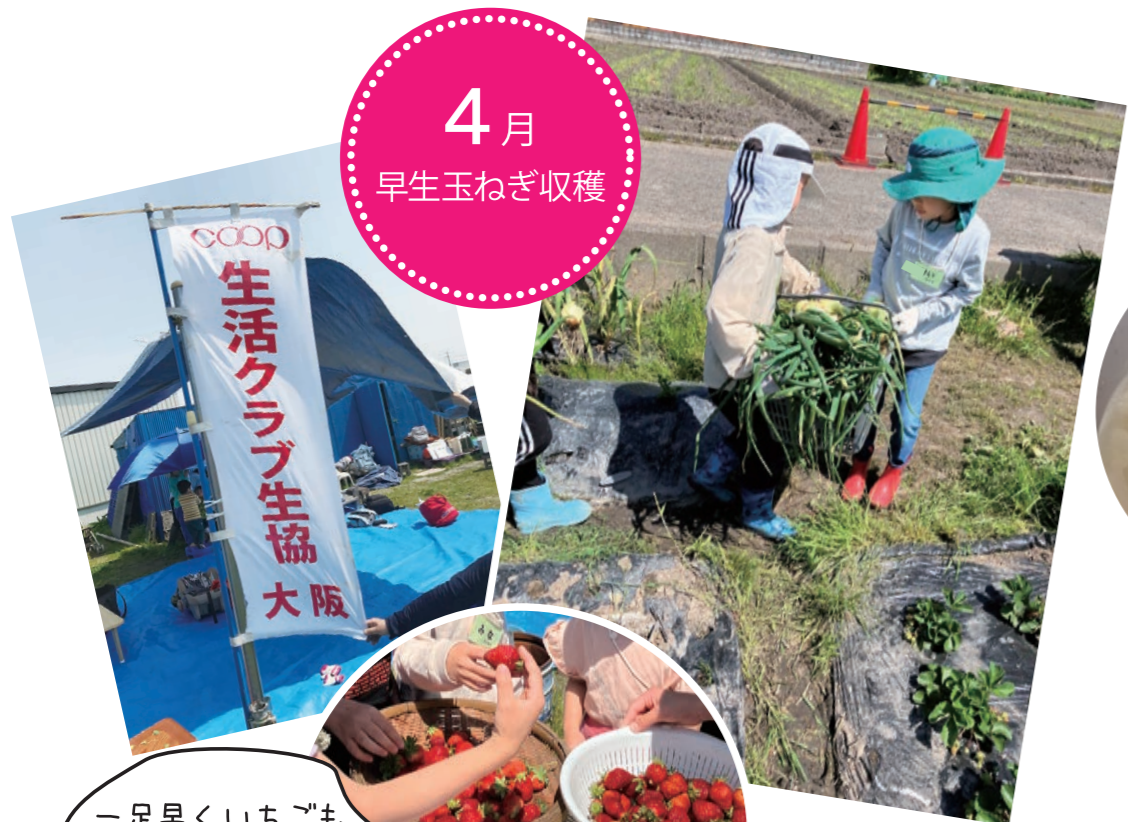
一足早くいちごも 楽しみました

4月は早生（わせ）玉ねぎの収穫体験から始まりました。体験をした人の中から今年の新しい仲間が加わります。