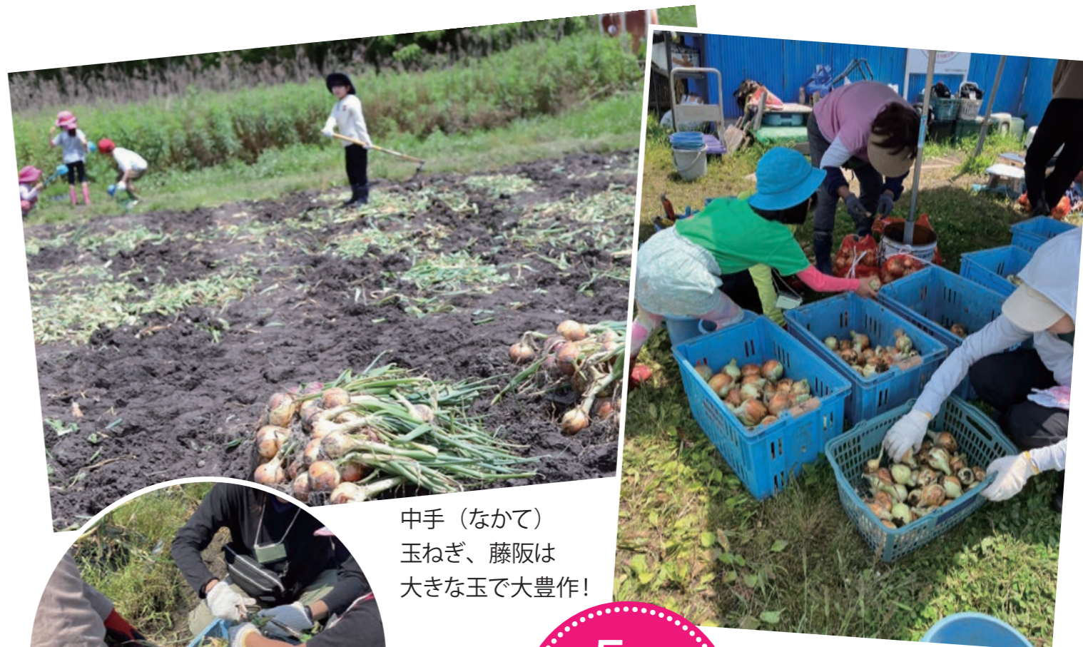
中手（なかて） 玉ねぎ、藤阪は 大きな玉で大豊作！