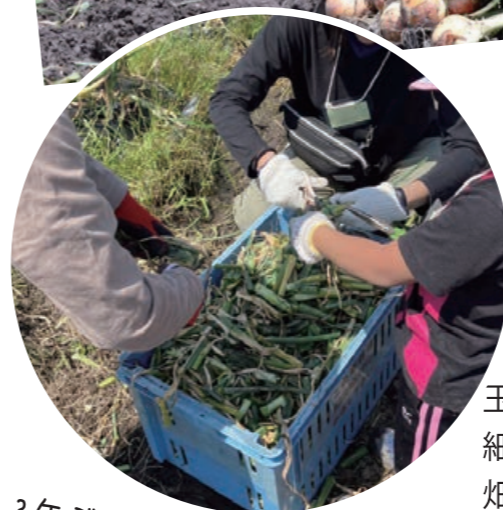
玉ねぎの葉は 細かく切って 畑に混ぜ込みます。