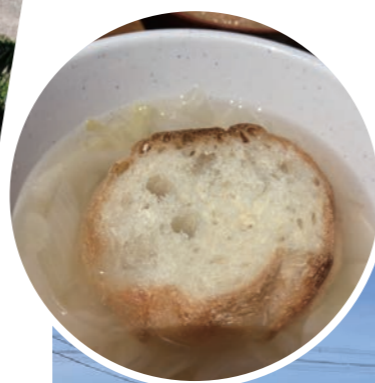
3年ぶりの 玉ねぎスープが おいしい！