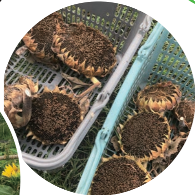
夕ネを収穫して復興 支援に役立ってます。

10/9のフェスタでは 飲み物とおつまみ セット、ハーブ 苗などを販売 しました。