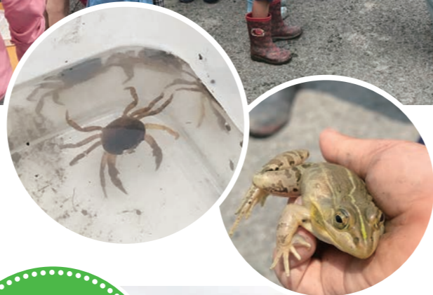
3年ぶりの生き物観察会。 芥川倶楽部の先生の話 熱心に聞く子どもたち。