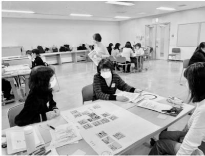
グループで意見を出し合う

次に、「子どもの権利条約31条」に関連した「ワニブタ」の4冊の絵本を紹介し、絵本『ようこそこどものけんりのほん』を読んで終わりとなりました。 このワークで参加者が子どもの権利について知り、それぞれの活動にどう繋げていけるかを考えるきっかけになればと思います。