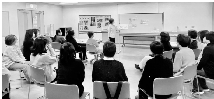
『ワニブタの本』『ようこそこどものけんりのほん』の紹介

参考：*『虐待禁止条例改正案』 2022年10月4日埼玉県自民党県議団が提出。その後撤回された。