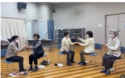
「ねずみ、ねずみ、どこいった」

紹介したサポーターの優しい口調と明るい楽しい歌に、とっても癒されたアイスブレイクになりました。