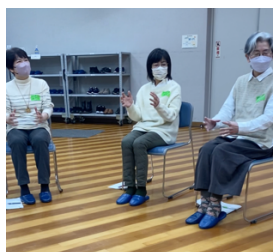
「とっちゃん、かっちゃん」