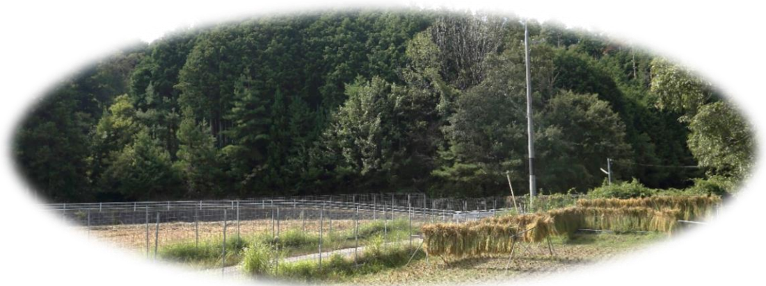
田植えし、草引きをし、収穫。自ら育てたお米を食べる