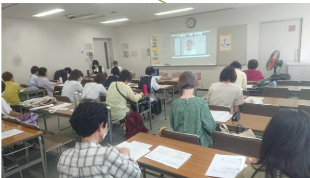
朗読した絵本 “あなたはそだつ”