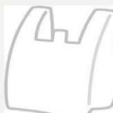
○ポリ袋 (汚れ物入れ)