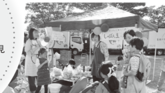
香里ブロック：フェスタの出展