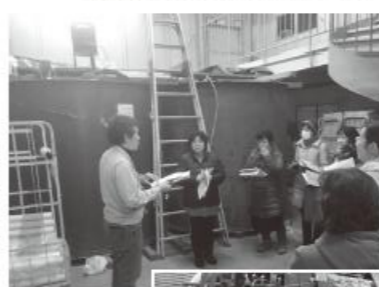
尊延寺センターにある BMW プラントを見学