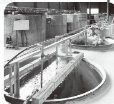
米沢郷牧場の BMW プラント

地球上でそもそも行われている自然循環を、人工的に再現した技術で、1~4槽のタンクに順に「鶏糞堆肥」「軽石」「花崗岩」に「水」と「空気」を送り込んでできる水のことです。画一的なものではなく、その土地の有機物を有効に活用し、「そこ」に居るバクテリア(土壌微生物)を活性化させることを第一に考え、ミネラルバランスの整った「(その土地にとっての)生き物にとって良い水」を作り出す技術です。