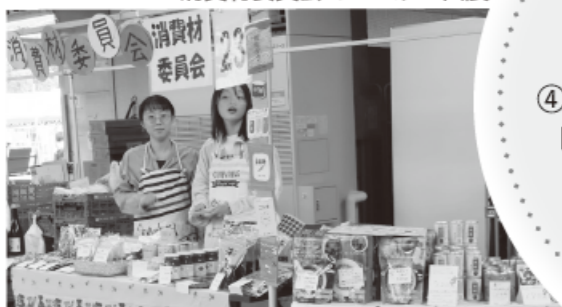
消費材委員会：フェスタの出展