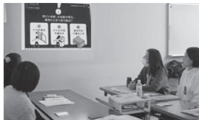
ジェルが固まる間に災害動画を視聴。防災の知識について学びました。防災クイズは大盛り上がり！