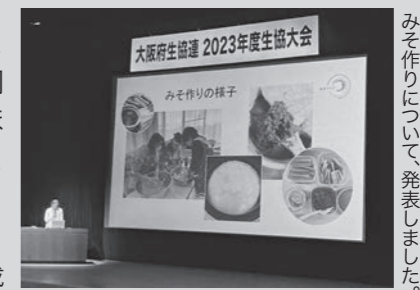
みそ作りについて、発表しました。

善する努力は不可欠だが、自分たちの命と暮らしを守る、生産と消費の信頼できるネットワークの確立が重要。今こそ協同組合の果たす役割は大きい」 お話を聞いて、私達が取り組んできた産直運動の意義を再確認できました。次に会員生協の活動報告があり、生活クラブ生協大阪からは、みそ作りに関する活動報告を行いました。展示ブースでは生活クラブでんきの紹介と、脱原発・脱石炭火力と再生可能エネルギーへの転換の加速を求める署名活動を行いました。(広報委員会 田上綾子)