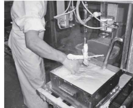
豆腐の凝固作業前に泡を取ります。