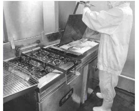
フライヤーでうすあげを1枚ずつ揚げています。

○団体の成り立ち 私達の豆腐は、生活クラブ生協大阪の前身の一つである大阪東部生協の独自開発品1号として、供給されてきました。ところが2006年3月に製造会社倒産し豆腐の供給が停止してしまいました。その後、有志数名が「もう一度豆腐造りがしたい」と表明し、生協連帯WILLネット(現・生活クラブ関西)の支援を受けて、同年9月に(株)豆伍心を設立して供給再開しています。 ○組合員とのあゆみ 会社倒産から豆伍心設立までの半年間で、各地区の交流会への参加や配送のトラックに同乗して組合員に供給再開までの進捗状況の報告を行っていました。その時の励ましや言葉などを胸に感謝の気持ちで製造に取組み、食べる人と直接交流できる楽しさを感じています。ずっと組合員に支えられながらだったので当初は恩返しのような思いが強かったですが、現在はそれ以上に食べる人の喜びになれるよう、日々