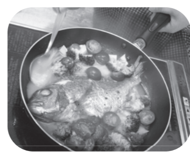
鯛のアクアパッツァ 味も見栄えも Good!

兵庫県漁連では、価値のある未利用魚を食べてバランスを守る取り組みをしています。冷凍の「瀬戸内海産はもカツ」や「フライパンで兵庫県産あかえい唐揚げ」など使い勝手のよい消費材がいろいろあるので、積極的に利用しましょう。(消費材委員会 宇野奈緒美)