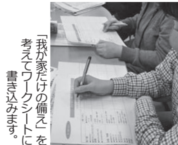
「我が家だけの備えを考えるとワークシートを書き込みます。」