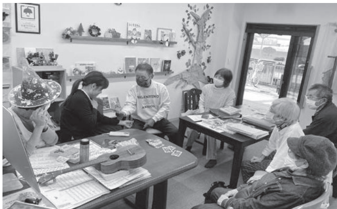
「うたごえよしみち」企画で、歌の合間にマジック披露中

「これやってみようかな」という声も出てきました。「洋裁するのでリフォーム教えられるよ」「今からマジックす