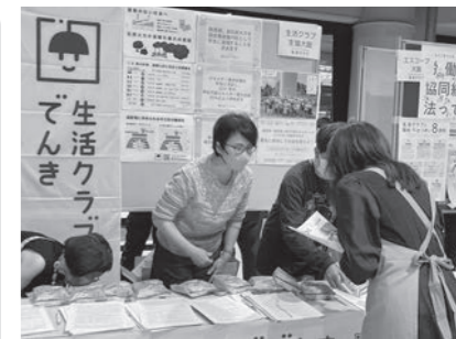
展示ブースでは、254筆の署名を集めました。