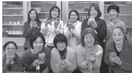
最後に作品を持ちパチリ