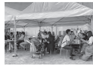
年に一度のフェスタ飯に舌鼓

おいしい匂いがあちこちから漂ってきっていた飲食スペース。何を食べようか迷っているうちに、「売切御免」となったブースも！ 試食も充実していました。