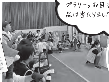
抽選を見守るまなざしは、真剣そのもの

Instagram風のフレームを掲げて「はい、チーズ！」。フェスタの楽しい雰囲気を伝えるべく、広報委員が会場内を奔走しました！