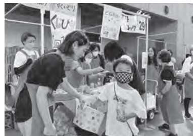
創意工夫いっぱいのブースが並びました