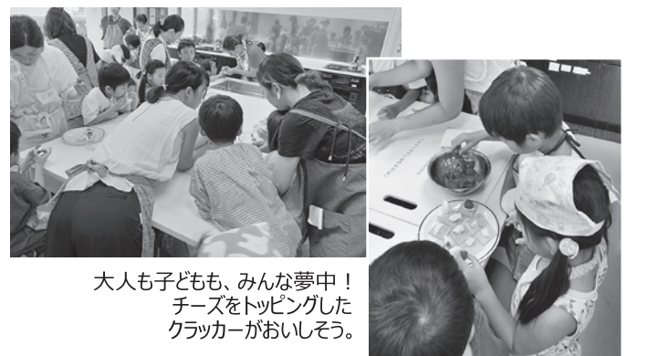
大人も子どもも、みんな夢中! チーズをトッピングした クラッカーがおいしそう。