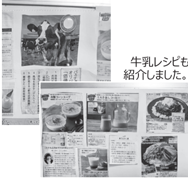
牛乳レシピも 紹介しました。