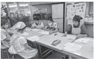
資料を掲示して、牛乳学習