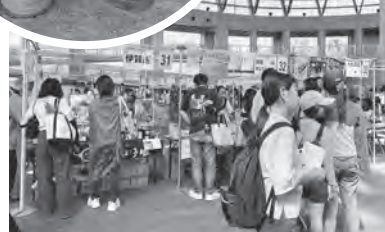
生産者との交流はフェスタの醍醐味