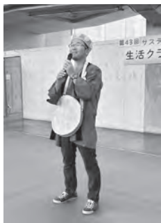
生産者の一言アピール

コロナ禍を経て、久々に復活したステージ。午前中は生産者からの一言アピール、午後はスタンプラリーの抽選会場としてにぎわっていました。抽選会には大勢の人が集まり、大いに盛り上がりました。