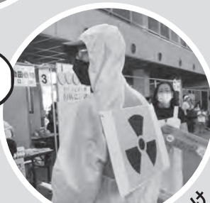
防護服姿で署名を呼びかけ