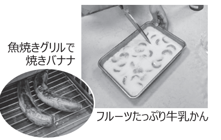
魚焼きグリルで 焼きバナナ

身体にいいのはわかっているけれど、牛乳を飲むのは苦手という参加者が、「手軽に使えるレシピでよかった」「家での牛乳の消費量が増えそう」とうれしい感想が多数。「最近バランゴンバナナ頼んでいなかったけれど、食べてみたら、やっぱり市販とは違う」と再発見したり、「バランゴンバナナスムージーは思ったより簡単にできるとわかった」「焼きバナナの甘さに驚いた」と、やはり食べてみなければわからないものだと4年ぶりの実開催のクッキングの大切さを感じました。(豊中中部地区 飯田美千代)