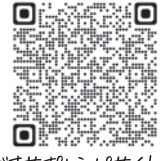
↑バイオサボリーサイトへ