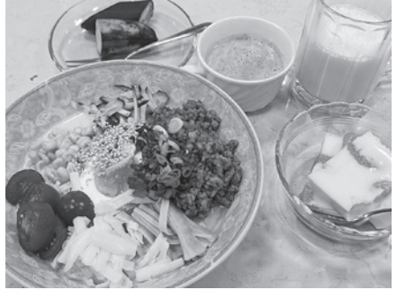
大好評だった牛乳ラーメン 2種の牛乳ドリンクとどうぞ。