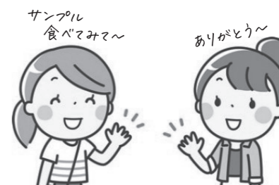
サンプル食べてみて～

私の考える生活クラブの良いところは、大きく3つあります。1つ目は学習会や生産者交流会を通じて、市販品と生活クラブ消費材の違いを知れたり、生産者の様子や話を聞けたり、普段メディアの情報だけではなかなかわからない