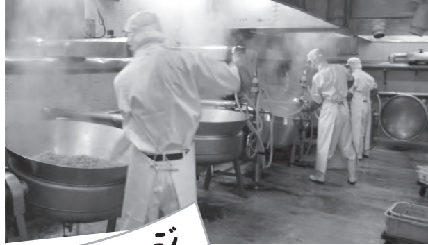
⇒具材のニンジンやゆでたまごは、具材のニンジンやゆでたまごです。