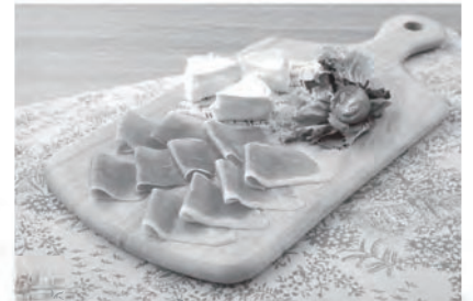
生ハムとカマンベールチーズ