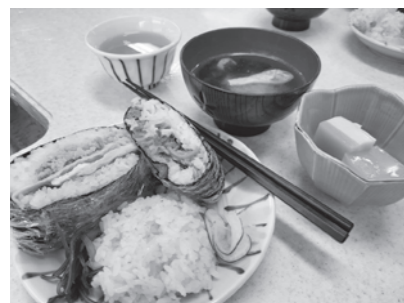
栄養満点、具たくさん おにぎらず

学習会の後はひと昔前(?)に流行った「おにぎらず」を作りました。簡単に作れて、有無を言わずに具も食べさせられる、子どものおやつにもいいねと、大変好評でした。