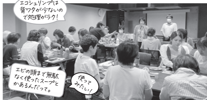
エコシュリンプは背ワタが少ないので処理がラク！