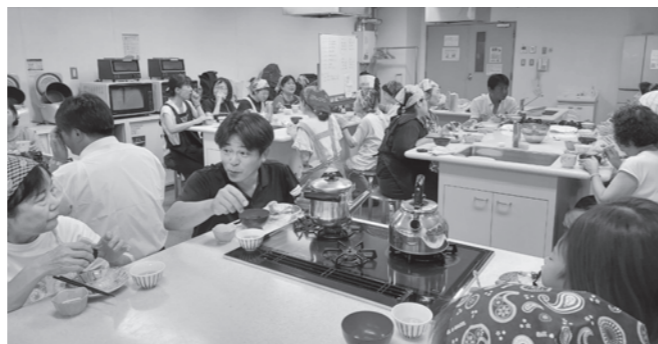
楽しい試食タイム グループ毎に生産者と交流しました。