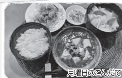
月曜日のこんだて

組合員：HM(40歳代) 生協歴：17年(ペア配) 家族：夫、子ども(高・中・小)3人 配達日：火曜日 1か月平均購入額：6万円