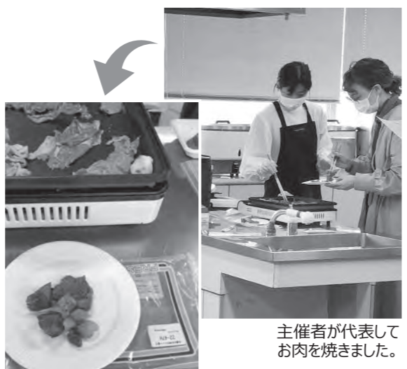
主催者が代表してお肉を焼きました。 焼けました! サイコロステーキ

試食したお肉は焼き過ぎたにも関わらず、おいしくて驚き。参加者からも「楽しかった」「おいしかった。よやくする」という声があがった。(箕面東地区 牛窪しずか)