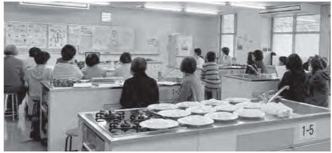
食べものの学習会では、試食することで消費材をより身近に感じることができます。

内容は合成添加物・合成着色料など不必要な添加物を使用せず、無リンすり身や天然調味料(魚介エキスなど)を使う練り物作りの大変さや工夫など、今まで知ることなかった話ばかりでした。さらには、表示しなくてもよい添加物のキャリーオーバーや、一般市場の価格の設定方法(まず価格ありきで、それに合わせて材料費を削っていく=質を落とさざるを得ない)もとても分かりやすかったです。参加者からは、改めて添加物の怖さを知り、「これからは表示をよく見て買う」「安心安全な消費材を届ける努力をしている生産者を支えていきたい」などの声を聞きました。今回は