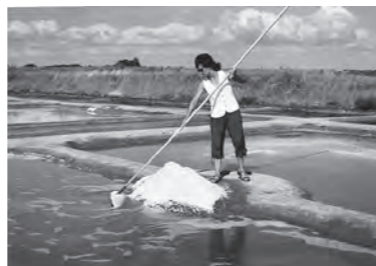
ゲランドの塩を収穫する風景