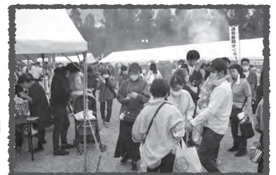
あっちからもこっちからも、いい匂い