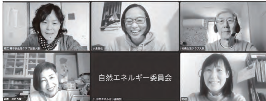
暮らしと電気のこと、話しましょう! 「エネカフェ大阪」オンラインで毎月開催中

からの気温上昇を1.5°C以内に抑えるという約束の実現は、ただの目標ではなく人類の生き残りをかけた課題です。世界で行動する人たちとめざすところは同じ! と、意義を感じて活動にとりこんでいます。活動を通じ、知らなかったこともたくさん知りました。気候やエネルギーが気になる方、この委員会に参加しませんか? 会議は月1回、それぞれできる範囲で活動してまいります!