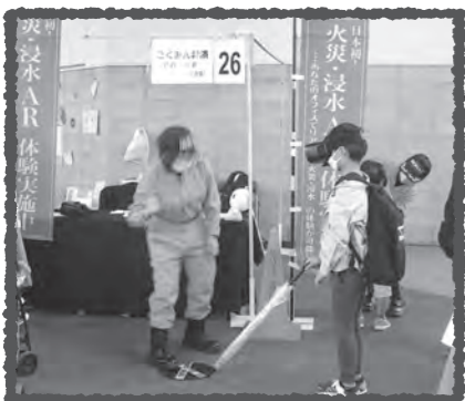
こくみん共済COOPによる防災VR体験