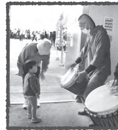
←オープニングも飾ってくれた、伊賀有機農産供給センター有志によるジャンベ(太鼓)の演奏。大人も子どもも惹きつけられました。