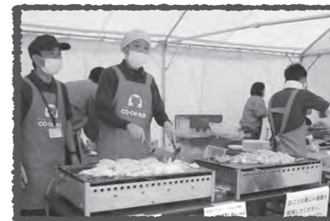
職員による恒例の焼きそば

気になっていた消費材の試食もできて、お得感もありました。フェスタ開始後まもなく行列ができ、早々に売り切れたブースも！