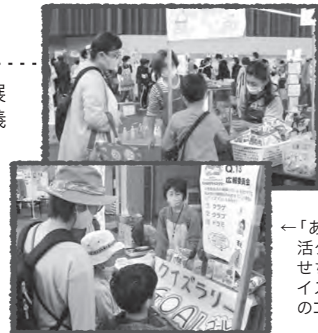
「あなたも生活クラブはかせちゃん！クイズラリー」のゴール