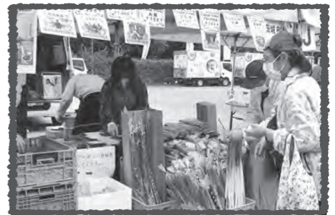
旬の野菜たちもズラリ！