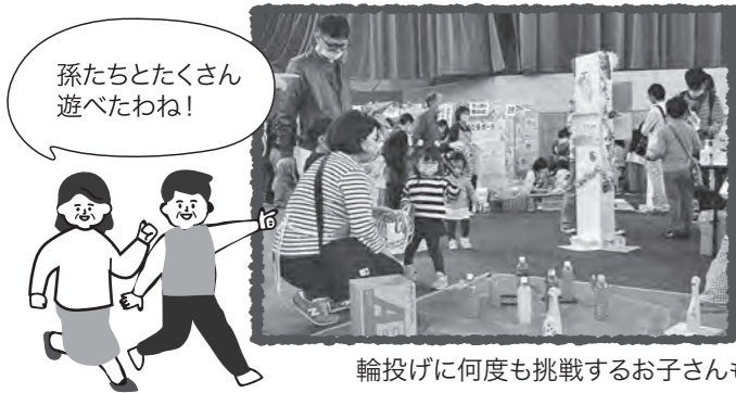
輪投げに何度も挑戦するお子さんも

無料でたくさん遊べるキッズランドは、今年も大人気！ 輪投げや指編み、折り紙など昔ながらの遊びを通じて、幅広い世代が交流していました。