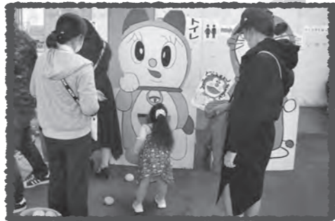
毎年人気のどらえもんコーナー