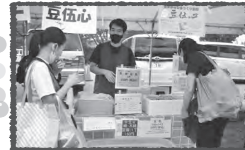
「豆腐はよやく・るで登録して、毎週食べてますよ」

3年のブランクもなんのその。生産者、組合員によるブースがたくさん並びました。いつもの消費材はもちろん、フェスタだけの「とっておき」や採れたての野菜など、ここでしか手に入らないものも満載。お買い物バッグいっぱいになっている人が大勢いました。