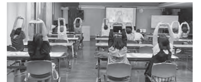
身体を伸ばしてリフレッシュ

中で軽い運動もあり終始和やかな雰囲気講座となりました。参加者からもわかりやすかった、バイオソバクティブを活用してヘルスケアに取り組んでみたいなどの声があり、好評でした。