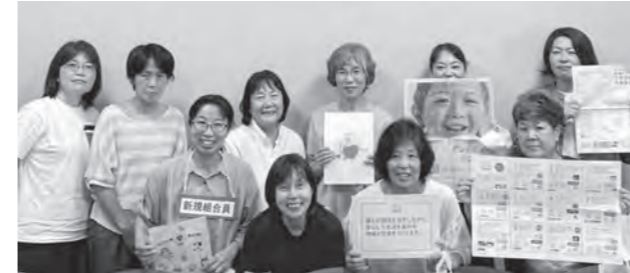
「2030 行動宣言」を掲げるエコロ委員会メンバー

エコロ委員会では、エコロ共済の意義や目的をどのように組合員の暮らしや地域に生かしていくのかを検討し、提案しています。そして、4つの部会と共に大阪のたすけあいの仕組み作りに取り組んでいます。