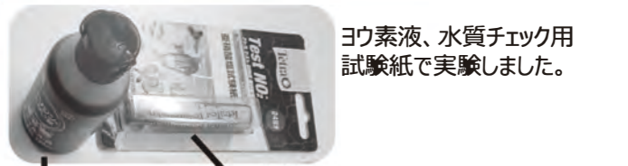
ヨウ素液、水質チェック用試験紙で実験しました。