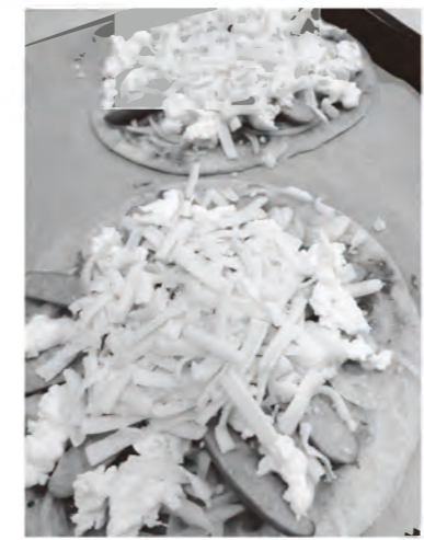
たっぷりの手作りモッツアレラチーズをのせたピザ