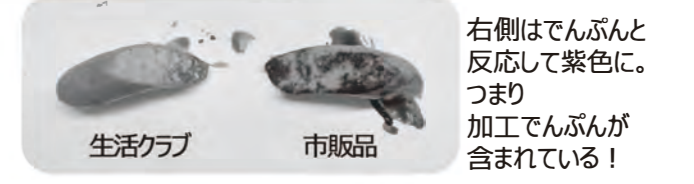
ヨウ素液をかけてみると... 生活クラブ 市販品 右側はでんぷんと反応して紫色に。つまり加工でんぷんが含まれている!