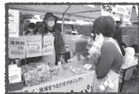
カレー味のれんこんソテーもおいしい