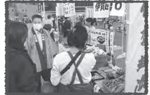
生産者との交流は、フェスタの醍醐味