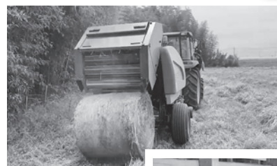
← 自前の干し草をロール状に (洲上牧場)