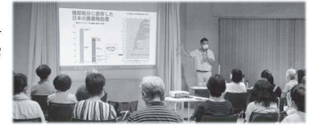
久々の講師を招いての学習会に多くの参加者が集う