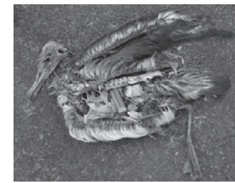
プラゴミで胃が損傷したり、窒息、栄養不足、プラに付着している毒物などで命を落とす。

川などを通じて流れ出した生活ごみで海洋のプラスチック汚染は深刻です。魚や貝、食塩、水道水などからプラスチックが検出され、人体も無関係ではありません。太平洋のミッドウェー島で死んだ鳥の雛のお腹からプラのライター、キャップなどが出てきた動画に多くの参加者が衝撃を受けました。