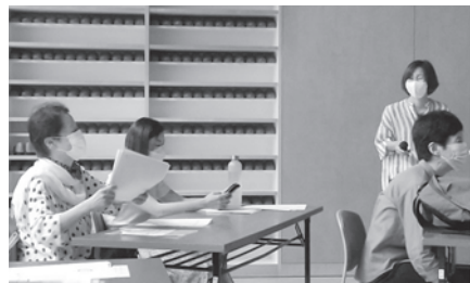
意見交換は和気あいあい、時には笑いも

2022年度、千里ブロックでは新生酪農の牛乳と米麦館タマヤのパンがお勧め消費材です。私たちの生活クラブの消費材の牛乳とパンについて学習する機会として、支部のつどいを開催しました。