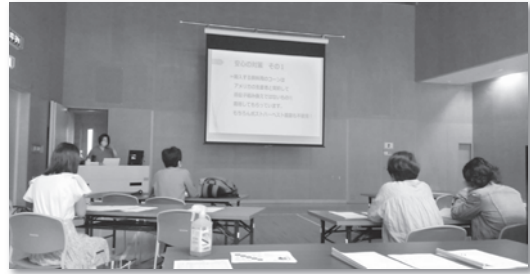
少人数でじっくりと… (吹田支部)

私たちは、地域の組合員の交流の場として、また地区委員など活動する組合員の学びの場として「支部のつどい」を開催しています。(支部は近隣の地区をいくつか集めて構成)