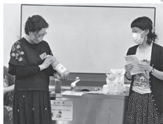
みかんジュースもリユースびんで〜。Rびんマークはどこかな?

こちらが話題のビンゴカード地区の企画に参加すると、手に入ります。ビンゴになると消費材の景品ゲット! みんなで地区企画にGO~!