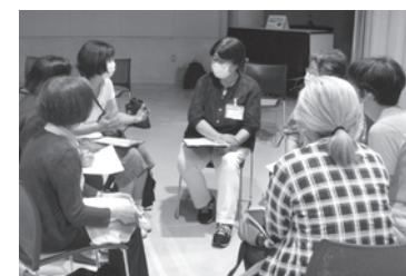
環境委員を中心に意見を出しあう

ゴミ拾いをしてごみマップを作り行政や事業者を巻き込んでレジ袋禁止、学校に給水器を設置、給水スポットを設置など、先進的な亀岡市の取り組みの話も聞きました。