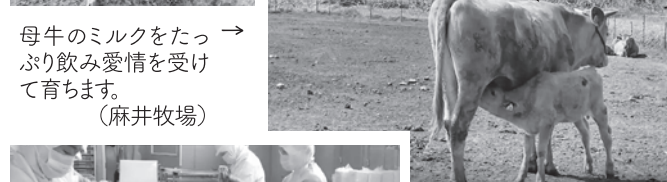
→ 母牛のミルクをたっぷり飲み愛情を受けて育ちます。(麻井牧場)