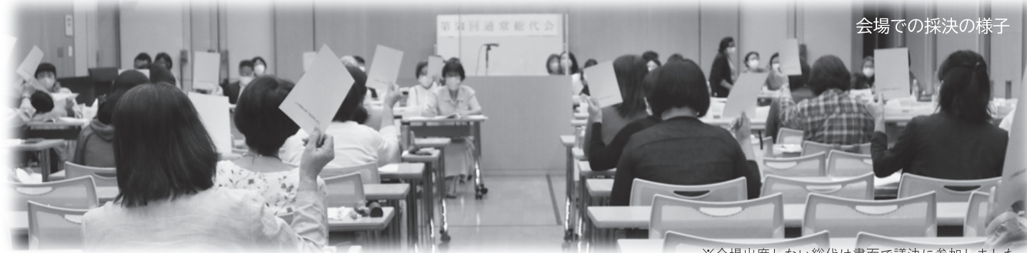
会場での採決の様子