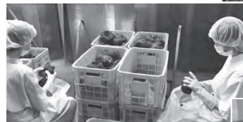
↑1日目: 蒸した芋を冷却し、一つずつ目視で検品する。