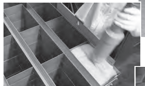
↑生のりと凝固剤を練り機で混ぜ、空気が入らないよう型枠へ入れ8時間炊く。