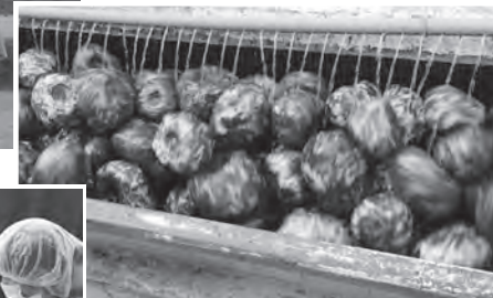
↑1年分のこんにゃく芋(和玉)を仕入れ、洗って冷凍保管する。