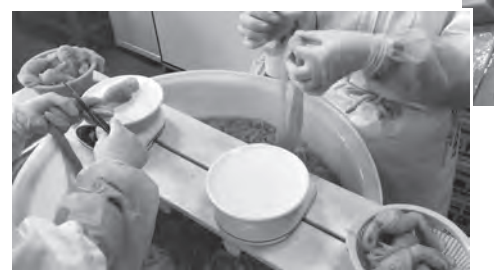
←「手結び糸こんにゃく」は、結ぶのも、計量も手作業!

生活クラブのコンニャクを生産者、大矢商店は兵庫県神戸市にあります。原料のコンニャク芋は栃木県、広島県などでこだわりの栽培方法で作られています。