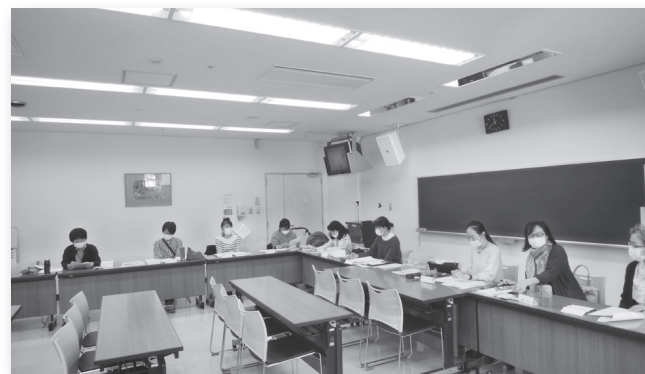
今年度の活動計画を皆で確認しました。

いつもはあまり会うことのない地区を超えたブロックでの集まり、これだけ多くの組員が役割を持って地域の中で活躍しているんだなあと改めて実感しました。