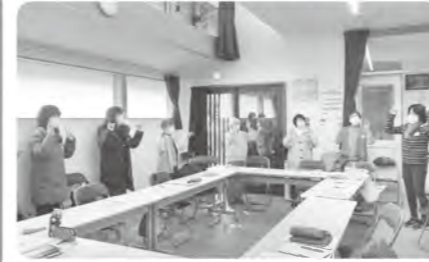
子どもと楽しめるよう、手遊び「やさいのうた」を練習しました。

生活クラブ生協大阪には、子育て中の組合員が企画や学習会、委員会活動などに安心して参加できるように託児システムがあります。そしてスタッフはより良い託児活動のため、研修会に参加して知識を深めています。現在活動中の託児スタッフと、託児活動に関心のある組合員による交流会に参加しました。 託児は、「子ども・組合員(保護者)・関わる大人たち」それぞれが学び合い、ともに成長しあう「とも育ち」の理念のもと運営されています。子どもと保護者、それぞれの気持ちに寄り添う託児を心がけていこうと、二つのテーマで意見交換がありました。