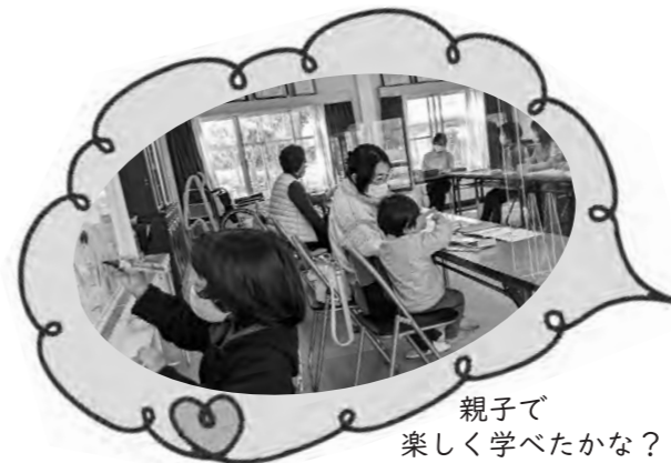
親子で楽しく学べたかな？

あなたはどんな未来を望みますか？ 地区の活動に参加して、ビジョン実現のために一緒に行動しませんか。地区発行のニュースもぜひ見てください。