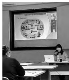
会場と自宅を結んで皆で学びました。

②の「物忘れと認知症の違い」では軽度認知障害(MCI)についての具体的な例として「好きだったドラマや読書が楽しくない」「集中力がなくなった」などが挙げられました。このような症状がみられたら早めに