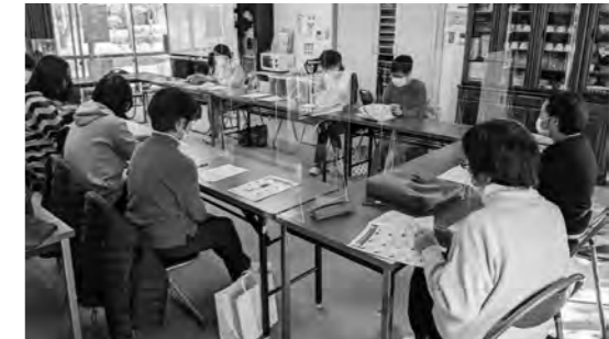
アクリル板で仕切って感染対策しています！

ウェアを洗う実演をしました。羽毛は水にとっても強い素材なので、しっかりと水に濡らすことが大切です。襟、