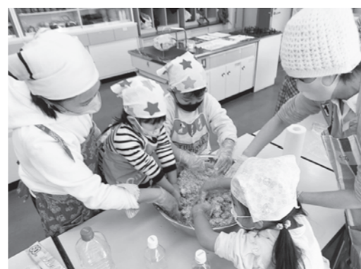
親子・お友だちでまぜまぜ 楽しそう! 「おいしくな〜れ♡」

茨木中央地区のみそ作りには、毎年たくさんのゲストが訪れます。みそ作りを通して、生活クラブが大切にしていることを伝えたいと、気楽に声をかけ、2人で分け合っている方も多いです。3回目の参加で加入した方もいます。託児ができないため、去年から休日開催ですが、平日来られない組合員や、親子参加も多く、喜ばれました。