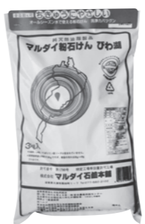
廃油から作った マルダイ粉石けんびわ湖