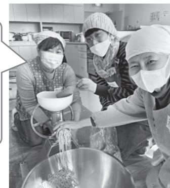
昨年のみそ作りで出会った2人が地区委員に加わり毎月楽しく活動しています。