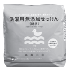
ウール洗いにも 無添加せっけん