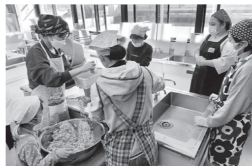
参加者みんなで協力すれば作業もはかどり、話はずみずみ。