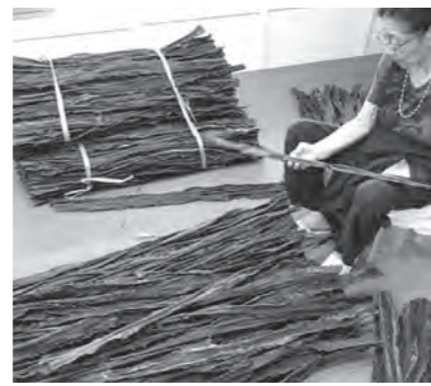
等級別、用途に応じて原料昆布を選別