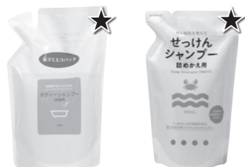
ボディ シャンプー