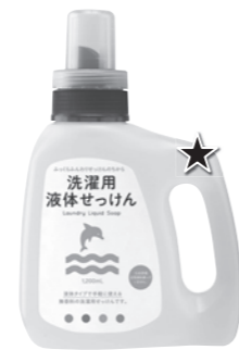
ドラム式に使いやすい 液体せっけん