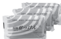
お風呂で使いやすい 浴用せっけん