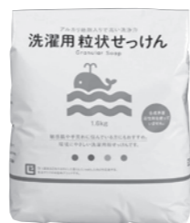
溶けやすくほのかな香り 粒状せっけん