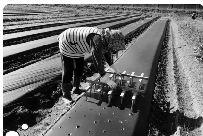
玉ねぎ植え-1 お手製の穴あけ機で植穴を開けている所(ニンニクも同様に穴を開ける)