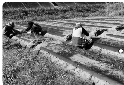
玉ねぎ植え-2 穴を開けた所に手作業で1本ずつ植えている

れんこん、セロリ、レモン、にんにくやさいBOX(太ネギ・白ネギ・にんにくの芽・葉玉葱・南瓜・そら豆)