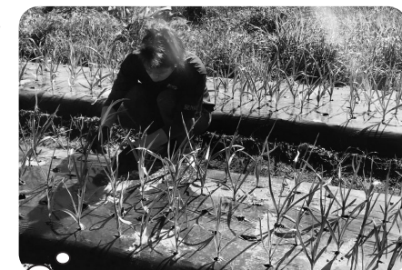
ニンニクの芽出し 植穴から出なかった芽を出す作業