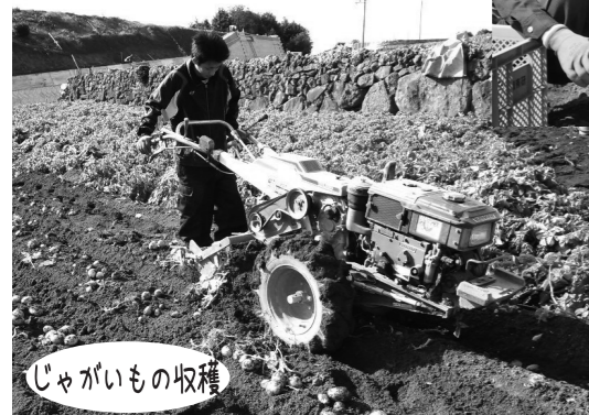
じゃがいもの収穫