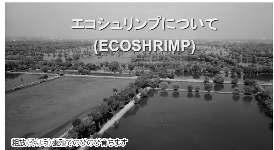
粗放(そほう)養殖でのびのび育ちます