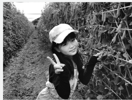
うすいえんどう畑でお手伝い中のお孫さん