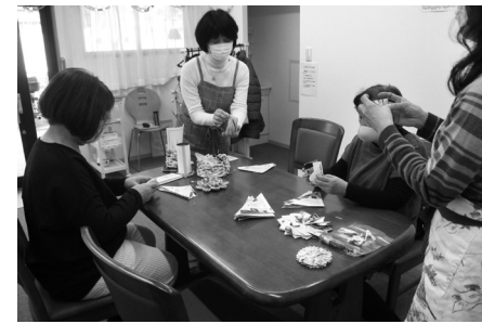
生協のカatalogや雑誌での鍋敷き作りを体験