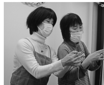
マクラメ編みにチャレンジ中のスタッフ。胸には手作りペンダント!

昨年11/28にオープンした「よりみち」。この間の新型コロナウイルス感染の拡大と緊急事態宣言により、開所できたのは12/2(木)の1日のみ。月1回のイベントも軒並み中止となり、少し心配しながら訪問しました。(閉所中も水曜日にスタッフが集まり、シャッターを開けて作業などを行っています。地域の方に「よりみち」の存在をアピールするためです)