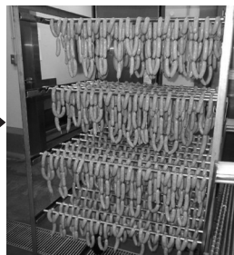
台車に吊って加熱