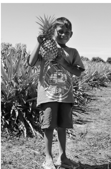
パイナップル農家の息子さん