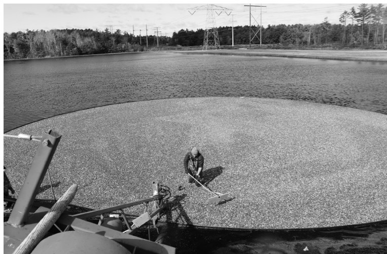
クランベリーの収穫風景 (円の内側が集められた真っ赤な果実) 「ウェットハーベスティング」という方法で、広大な畑に大量の水を入れ、機械でかき回し、果実を浮き上がらせて収穫する。