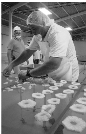
カットしたパイナップルを並べる。