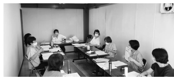
議論が飛びかう部会

活動開始からすべてが手探りの中、メンバーそれぞれが知恵や経験を出し合いました。他団体がすでに運営している居場所の見学や地域包括支援センターからのアドバイスは、居場所のイメージづくりの参考になりました。