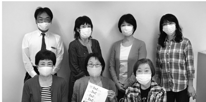
熱い思いで準備を進めてきた香里ブロック居場所づくり部会メンバー