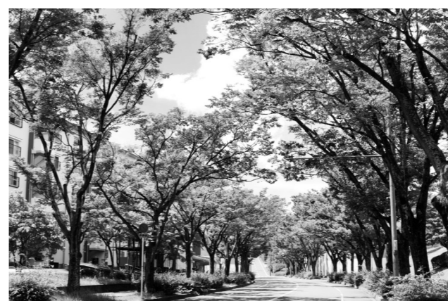
「枚方八景」の一つ、美しいケヤキ並木沿いに誕生

オープン：2020年11月28日 場所：枚方市香里ヶ丘9-9-1 香里団地D47棟 1階 開所日：週1回・水曜日（予定） 時間：10:00～15:00（予定）