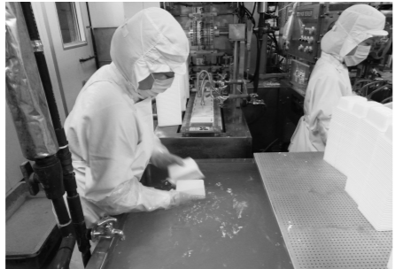
素早く包装して十分冷やします。