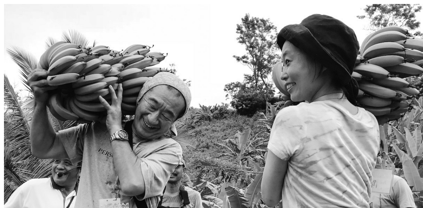
2018年ネグロスツアーでの収穫体験

届くと嬉しくて、バナナニユースを読みながらまずその場で1本食べます。届きたては皮がしっかりとっていて、一番香りを楽しめる気がします。だんだん甘みを増し、コクも出てくる野性味溢れるbalan gon。ホロっと手に割ってパンにのせたり夏は凍らせた