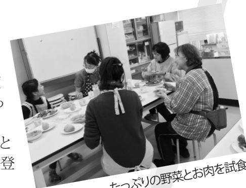
たっぷりの野菜とお肉を試食