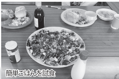
簡単ごはんを試食