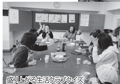
盛り上がる生活クラブクイズ