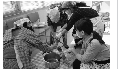
手動ミンサーで奮闘