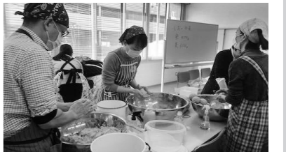
材料をまるめる。男性の参加もありました。