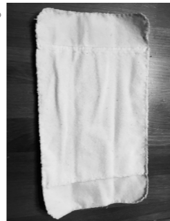
出来上がった布ナプキン(小)

きめ細かなネル生地を使って、切りっぱなしの縁をかがるだけで布ナプキンができて驚きました! 体にも環境にも優しいので早速使いたいと思います。