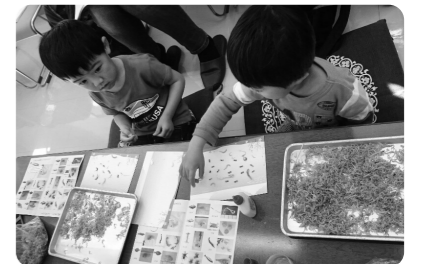
ちりめんモンスターを探せ