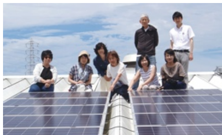
生活クラブ関西 岸和田デリバリーセンター