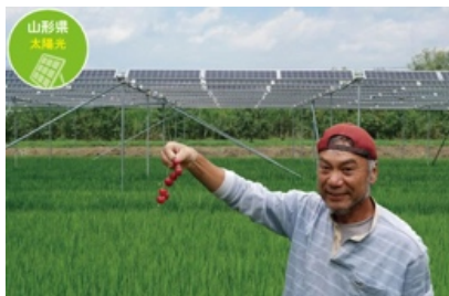
山形県長瀬農園 ソーラーシェアリング

電気料金プランには、「節電する人を応援したい」という私たちの声反映されています。これからもっと使いやすくしていける電気！事業所屋根の太陽光パネルや、生産者の田んぼソーラーでも発電中！大切に使いながら、開発中の小さな再エネ発電所を見守りましょう。